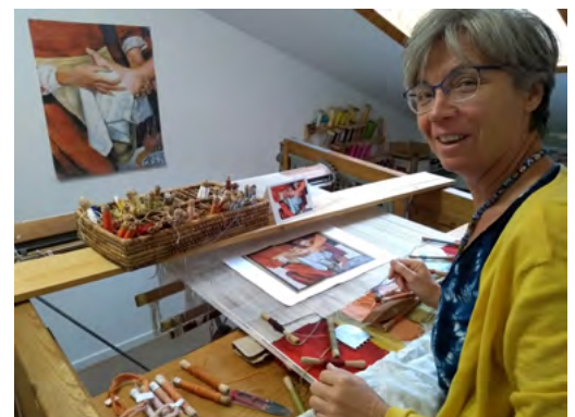
Le lavement des pieds, commande privée d'une interprétation de l'huile sur toile du peintre Arcabas.

Dans son atelier auvergnat, cette interprète lissière dessine le carton à partir de la maquette originale (œuvre d'artiste, photo), élabore le chapelet de couleurs et de matière et tisse de A à Z . Un travail à quatre mains, réunissant la créativité de l'artiste et le savoir faire de l'artisan.